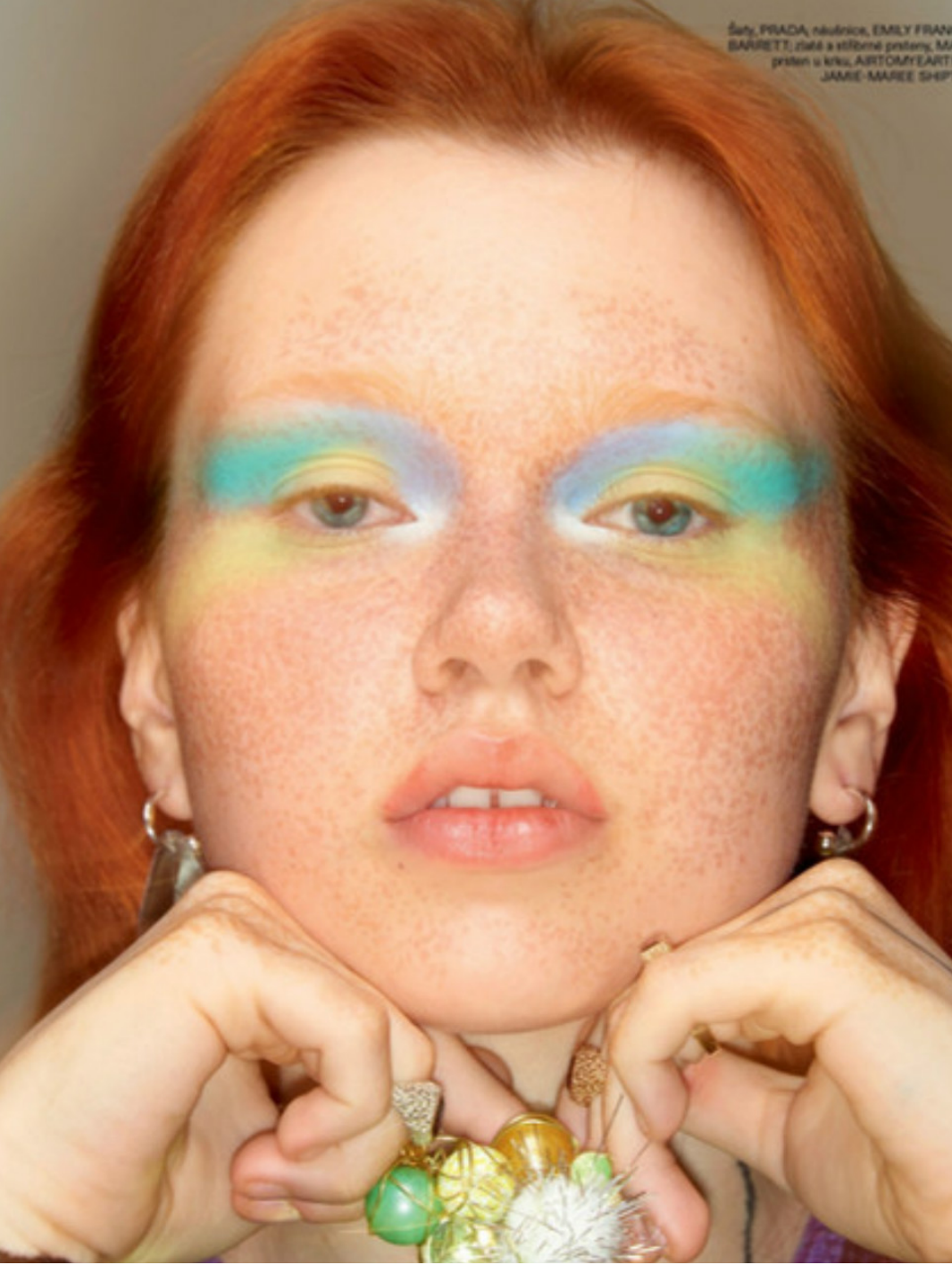
Šaty, PRADA; náušnice, EMILY FRAN BAURETT; zlaté a stříbrné prsteny, MA prsten u krku, ARTOMYART JAMIE MAREE SHIP