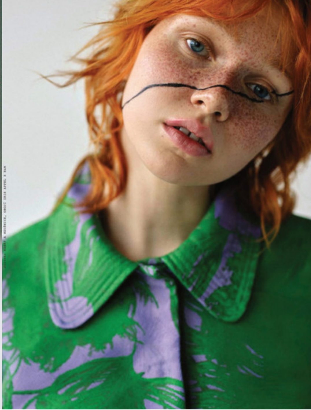
FOTOGRAFIE: RICHIE M. MACHINIST, OBRÁZKY: DESS APPEL & DAN